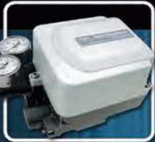
Serie IP 8101