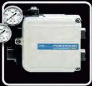
Serie IP 8100