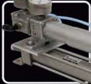
Serie IP 200 (posicionador lineal)