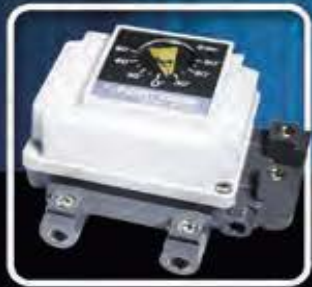
Serie IP 5100