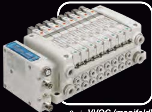
Serie VVQC (manifold)