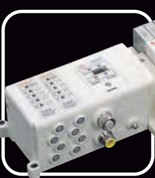
Serie SS5Y (manifold)